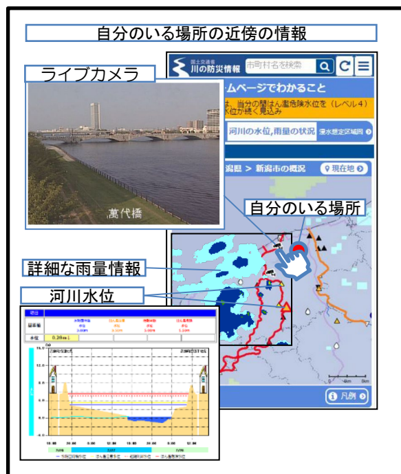
② 洪水氾濫による被害の軽減、避難時間の確保のための水防活動の取組