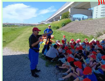
先生に生き物の 詳しい解説を していただきました！