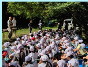
生き物を見つけるコツを 教えてもらいました！

小学生のみなさんに川の調査隊の隊員になってもらい一緒に川に入って川の中に住む生き物を捕まえました。