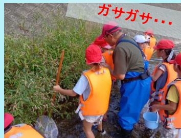
生き物を捕まえる ポイントを教わって…

小学生のみなさんに川の調査隊の隊員になってもらい一緒に川に入って川の中に住む生き物を捕まえました。