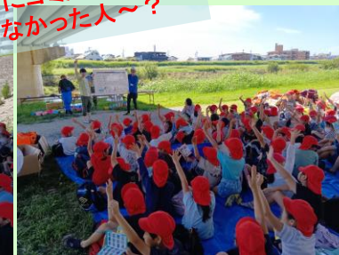
水のおいや川底の感触など 人の感覚による調査にも 実施しました！

【問い合わせ先】国土交通省 近畿地方整備局 猪名川河川事務所 工務課 〒563-0027 大阪府池田市上池田2-2-39 TEL 072-751-1111(代)