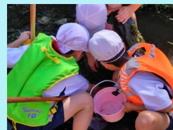
石の裏にいるかな？