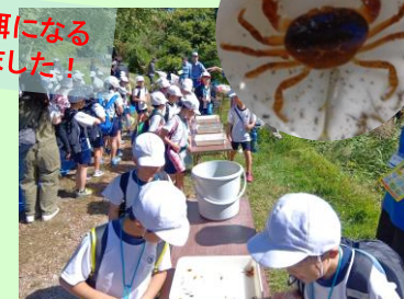
採れた生き物を観察！

【問い合わせ先】国土交通省 近畿地方整備局 猪名川河川事務所 工務課 〒563-0027 大阪府池田市上池田2-2-39 TEL 072-751-1111(代)