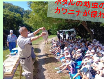
みんなが捕まえた生き物を 先生に詳しく解説を していただきました！