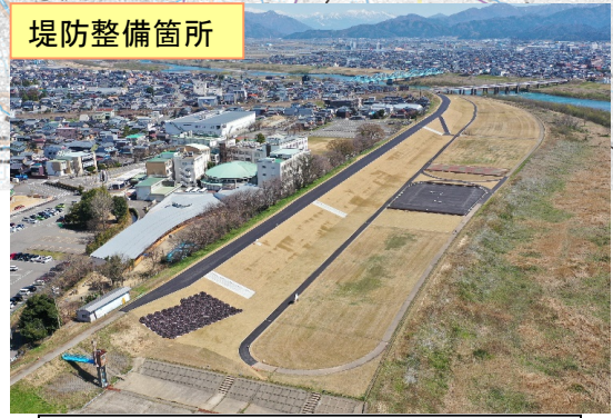
拡築工事の実施（九頭竜川天池地区）