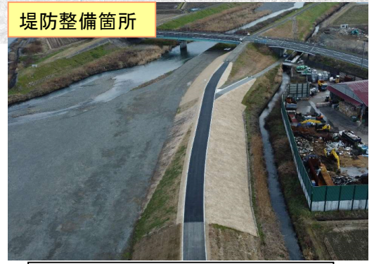
拡築工事の実施（北川平野地区）

堤防の整備（堤防拡幅）とは本来堤防が有すべき計画の断面積（高さ・幅含む）を満足していない堤防について、盛土等を施し、計画断面を築造する整備です。