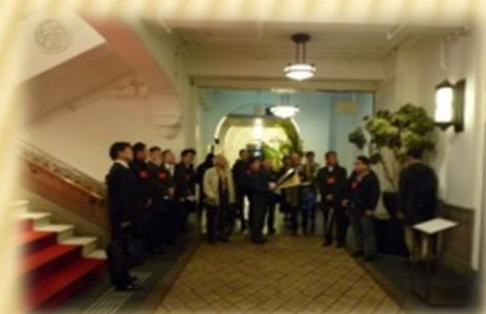
ミライザ大阪城施設見学