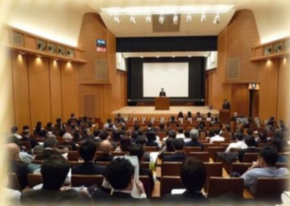
村上営繕部長 あいさつ