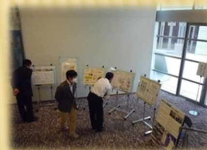
同時開催の第28回「あすなる夢建築」 大阪府公共建築設計コンクール入選作品展

主催／一般社団法人 公共建築協会 近畿地区事務局 後援／「公共建築の日」及び「公共建築月間」近畿地方協力支援会議※