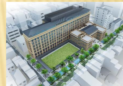
ザ・ゲート立誠京都（仮称） ～現在施工中～