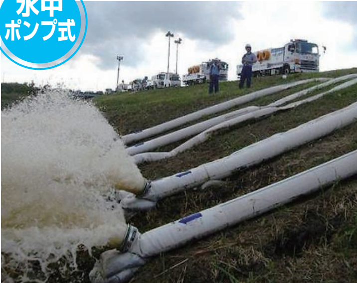
H27関東・東北豪雨(茨城県常総市)