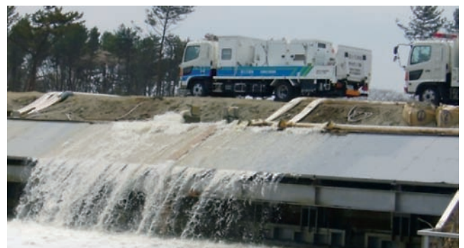
H23東日本大震災(宮城県仙台市)