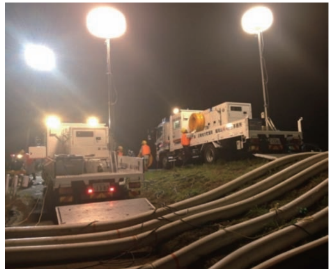
H27関東・東北豪雨(茨城県常総市)