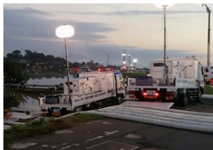
H27関東・東北豪雨(茨城県常総市)