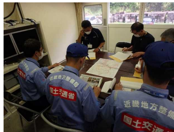
7/21【道路班】調査結果を報告(八代市)