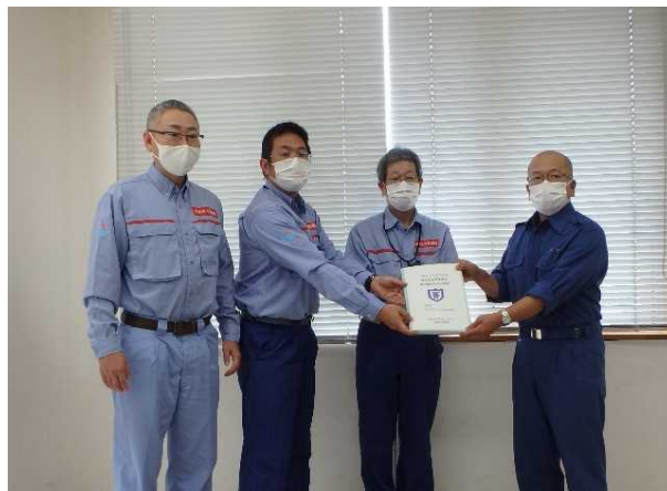
7/21【河川班】調査結果を手交(芦北町)