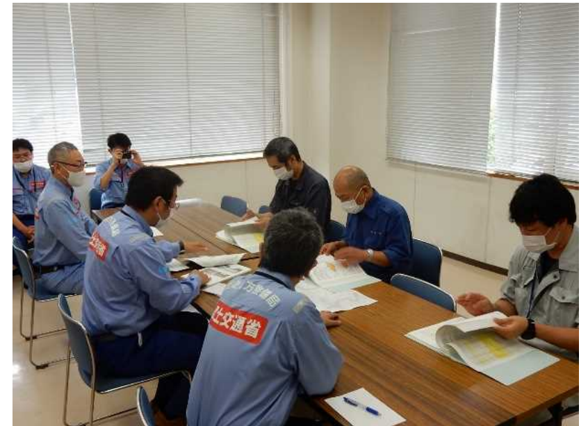
7/21【河川班】調査結果を報告(芦北町)