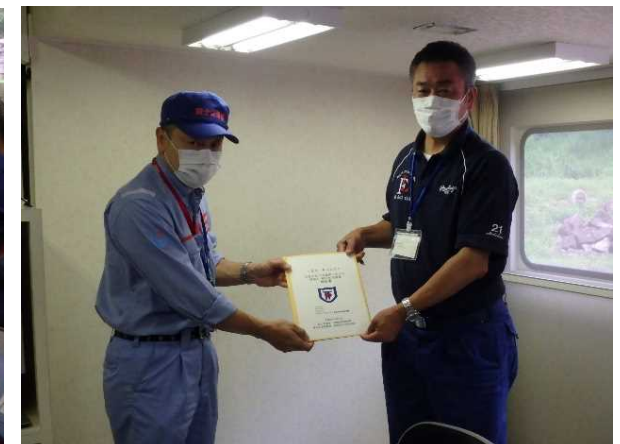
7/21【道路班】調査結果を手交(八代市)