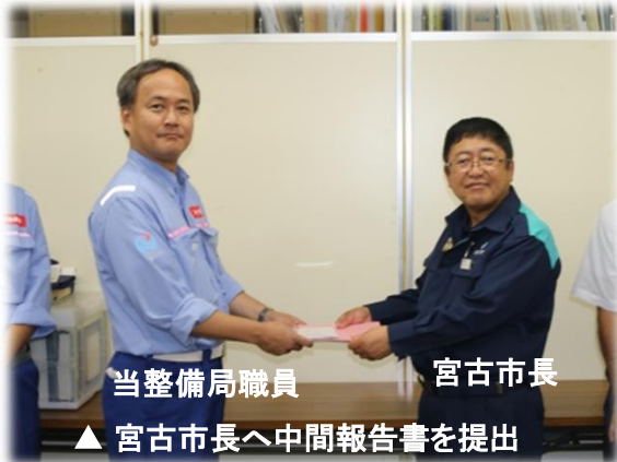
9/7(水)の活動写真 現地調査中間報告(宮古市)