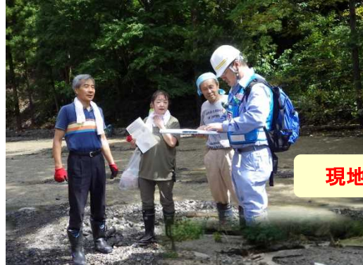
現地調査状況(岩泉町穴沢地区)