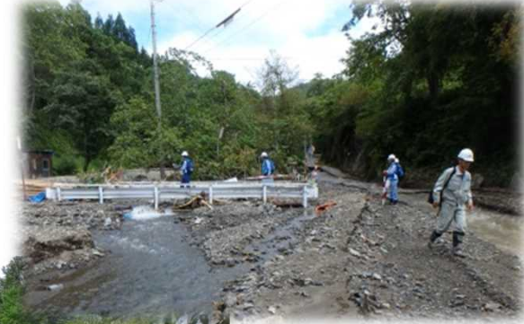
現地調査状況(岩泉町門地区)

9月3日(土)より、全地整TECで孤立者支援のための道路啓開状況調査実施中 (全17班:東北3、関東3、北陸6、中部3、近畿2)