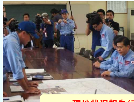
現地状況報告(東北地整)