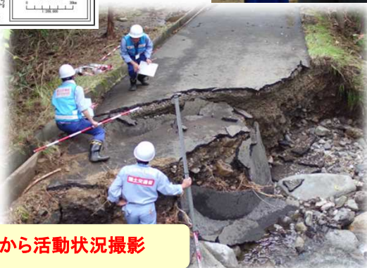
ドローンから活動状況撮影