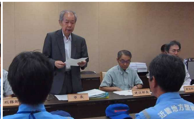
↑ 宇津浜田市長からのお礼 →