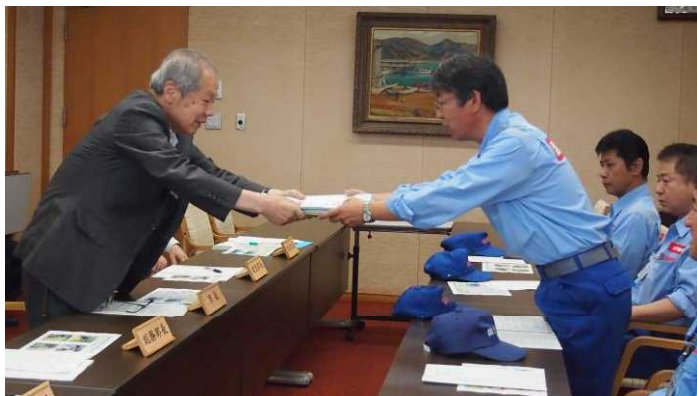
↑ 近畿地整橋本隊長から浜田市長へ成果の引渡し