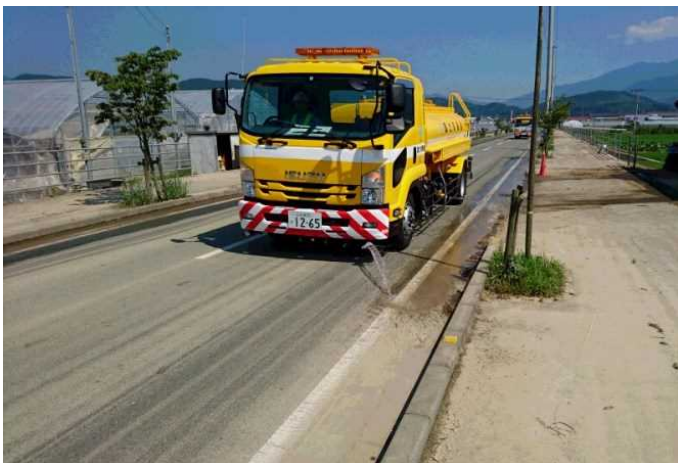
7/15 愛媛県大洲市内散水状況