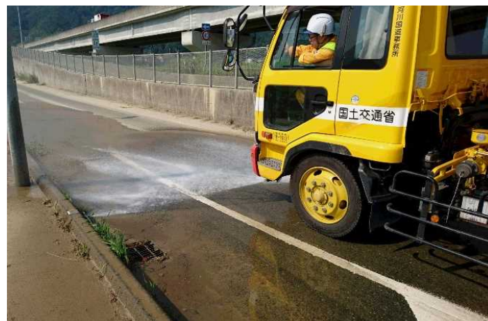
7/16 愛媛県大洲市内散水状況