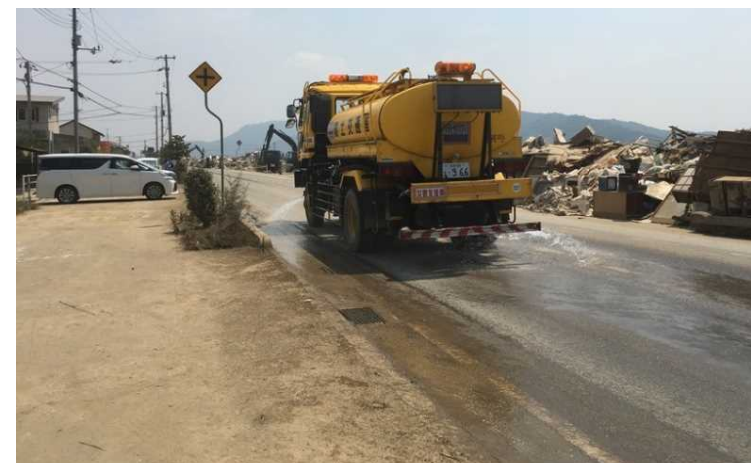
7/17 岡山県倉敷市内散水状況