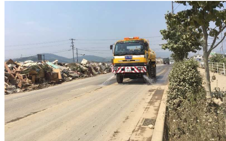
7/17 岡山県倉敷市内散水状況