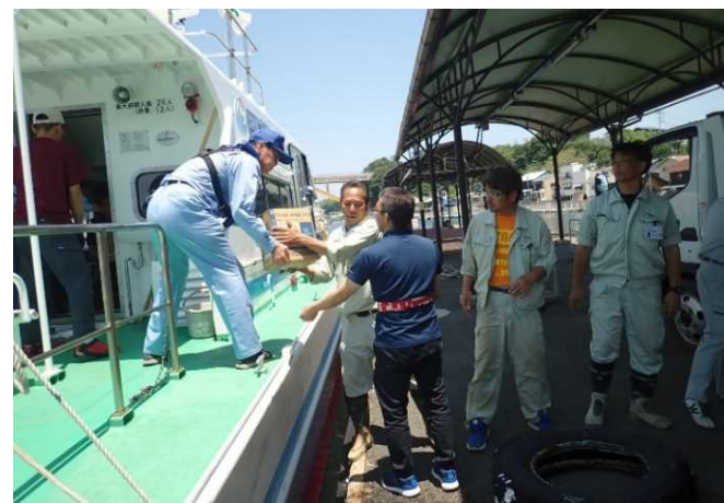
尾道市支援物資荷卸状況(瀬戸田港)