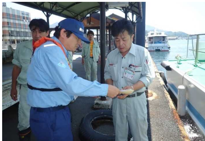
尾道市支援物資引渡状況(瀬戸田港)