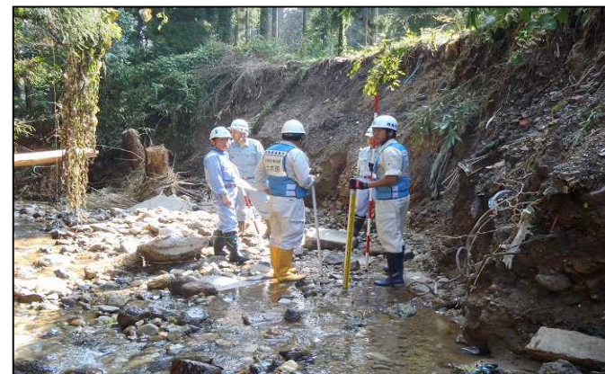
土砂崩 (安曇川町中野)