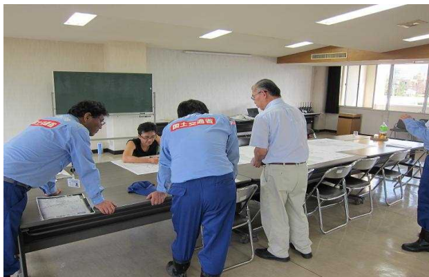
敦賀土木事務所職員との打合わせ