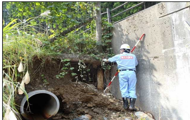
橋台・護岸欠損 (朽木地子原地区)