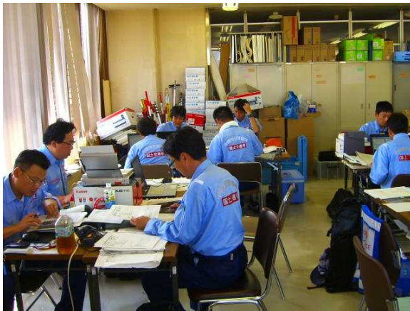
道路班及び河川班による報告書作成