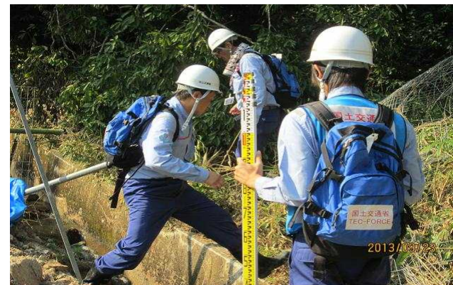
三味線川被災調査