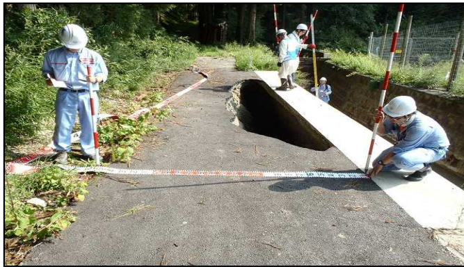
道路被災調査 (朽木栃生地区)