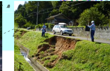
早期復旧に向けた調査 (綾部市志賀郷地区)