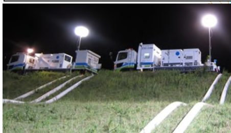
排水ポンプ車による緊急排水 (福知山市荒河地先)