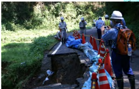
早期復旧に向けた調査 (舞鶴市白滝地区)