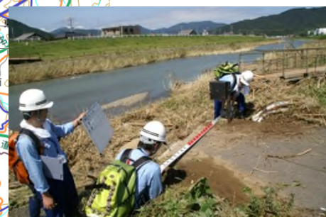
早期復旧に向けた調査 (舞鶴市境谷橋)