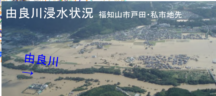
ヘリコプターによる浸水状況調査