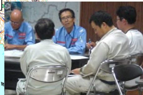
被災状況・要請内容等の把握 (小浜土木事務所)