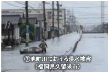
【令和3年8月からの大雨】