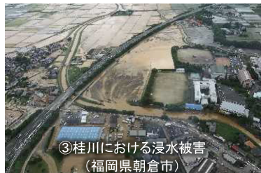
【平成29年7月九州北部豪雨】