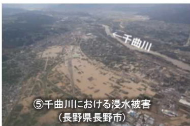
【令和元年東日本台風】