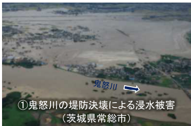
【平成27年9月関東・東北豪雨】