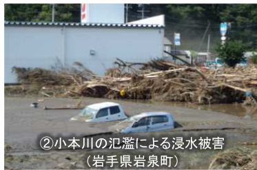
【平成28年8月台風第10号】