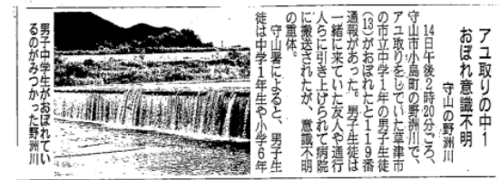
平成27年8月5日 産経新聞