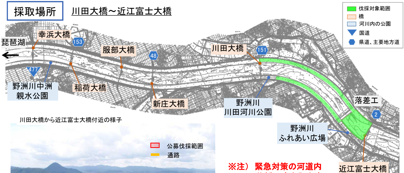
川田大橋から近江富士大橋付近の様子