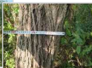
伐採対象の樹木のイメージ