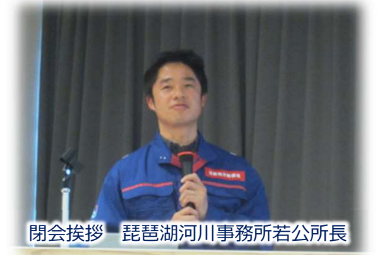
閉会挨拶 琵琶湖河川事務所若公所長