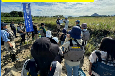
工事概要説明の様子