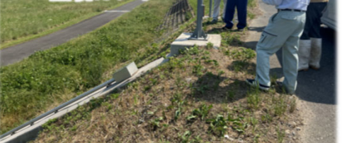
守山市川田町地先

大規模水害が起こりうること、また、琵琶湖水位の影響を受け浸水が長期に及ぶことを念頭に、「自ら行動し、地域の防災力を高め」、「社会経済被害を最小化」するための取り組みを実施し、水害に強い地域を目指します。