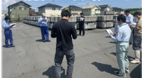
野洲市市三宅地先