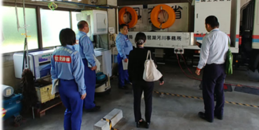
琵琶湖河川事務所災害対策車両車庫