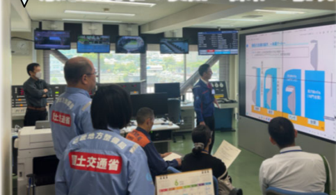
琵琶湖河川事務所内瀬田川洗堰操作室