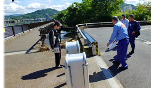
大津市千町一丁目地先