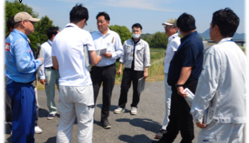
守山市新庄町地先