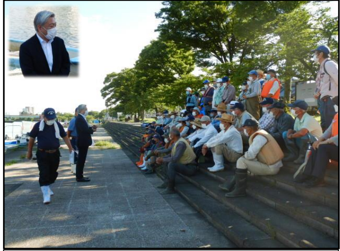
朝礼時の状況(佐藤大津市長挨拶)