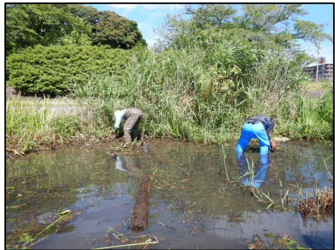
特定外来植物の除去作業状況