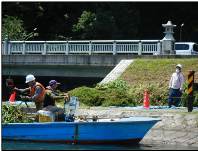
水草揚陸・仮置き場所(瀬田川右岸73.2k付近)