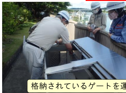
格納されているゲートを運搬し、設置を行いました。