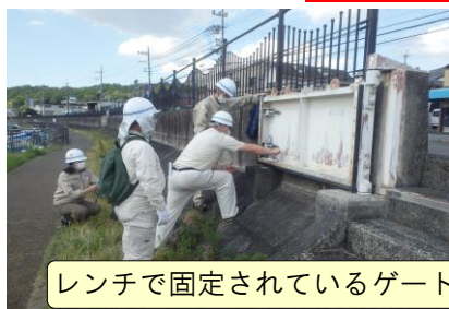
レンチで固定されているゲートを解除し、設置を行いました。