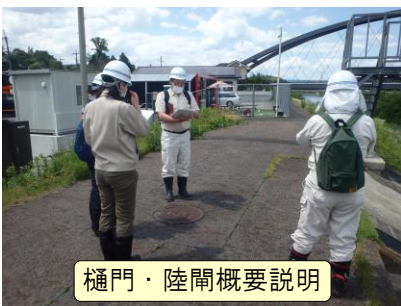
樋門・陸閘概要説明