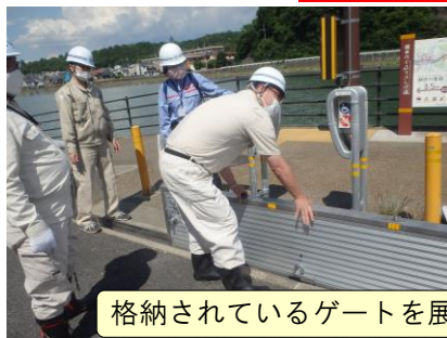
格納されているゲートを展開し、設置を行いました。