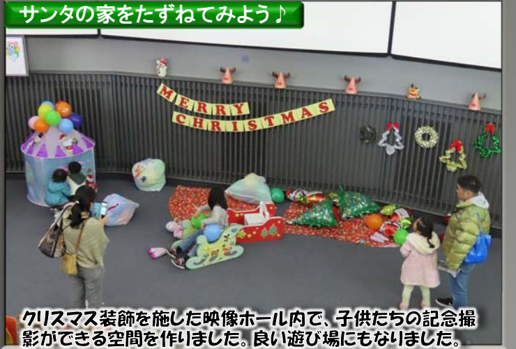
クリスマス装飾を施した映像ホール内で、子供たちの記念撮影ができる空間を作りました。良い遊び場にもなりました。