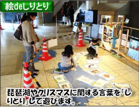
琵琶湖やクリスマスに関する言葉を「しりとり」して遊びます。