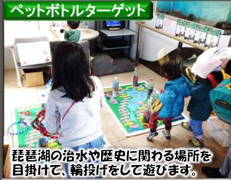
琵琶湖の治水や歴史に関わる場所を目掛けて、輪投げをして遊びます。