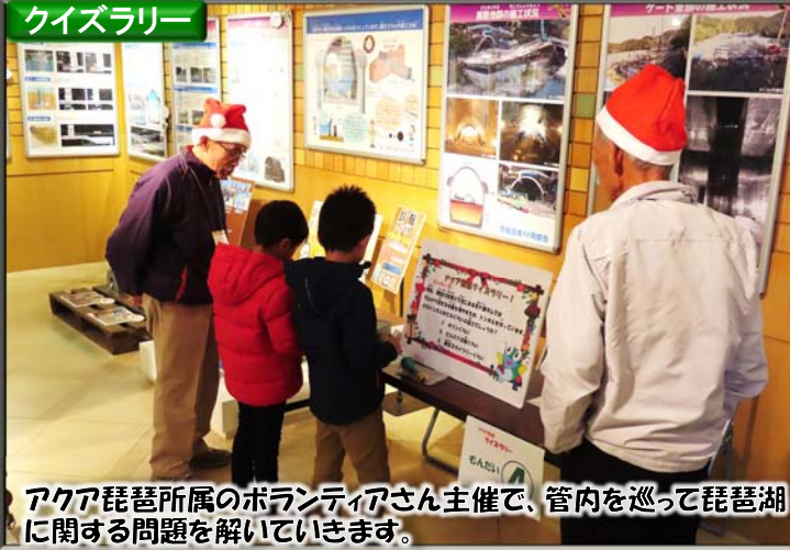
アква琵琶所属のボランティアさん主催で、管内を巡って琵琶湖に関する問題を解いていきます。