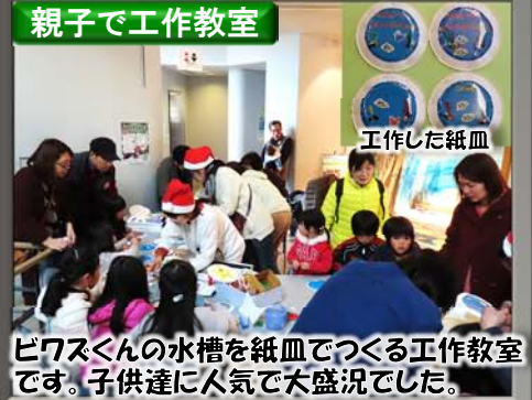
ピワズくんの水槽を紙皿でつくる工作教室です。子供達に人気で大盛況でした。