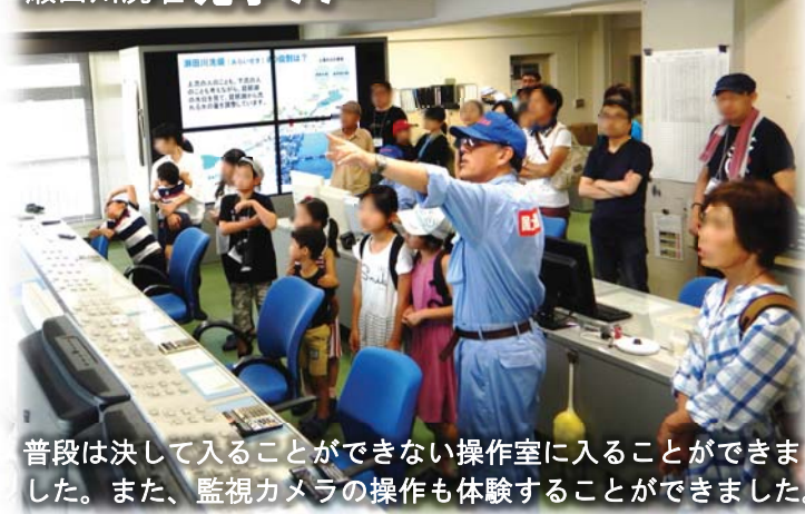
普段は決して入ることができない操作室に入ることができました。また、監視カメラの操作も体験することができました。