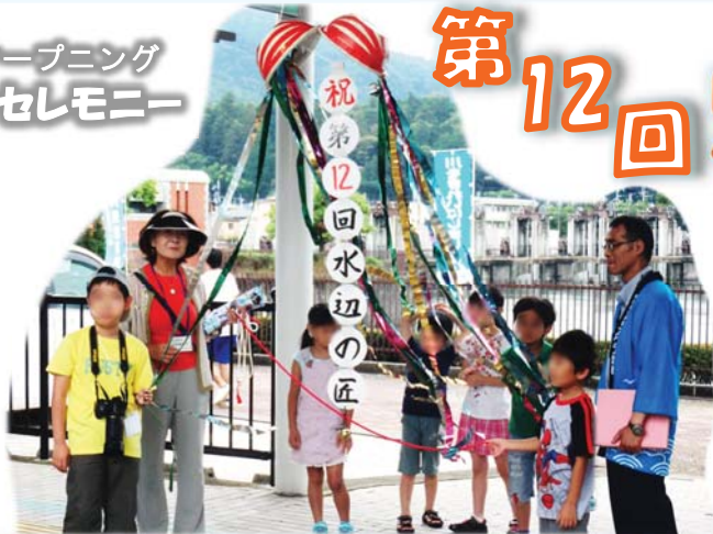
オープニングセレモニーでの集合写真