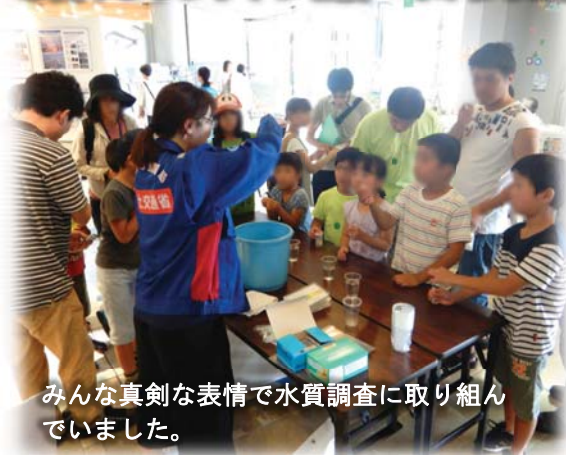
みんな真剣な表情で水質調査に取り組んでいました。