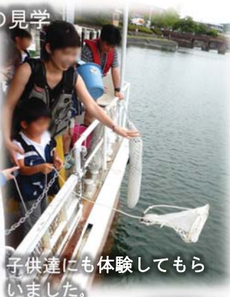
子供達にも体験してもらいました。