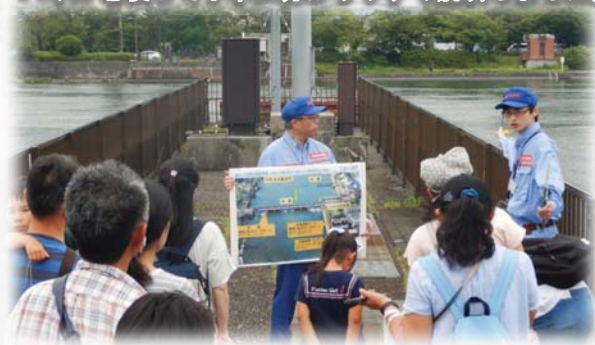
旧洗堰の歴史や仕組みについて説明しました。