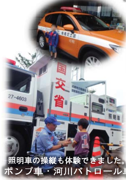
照明車の操縦も体験できました。