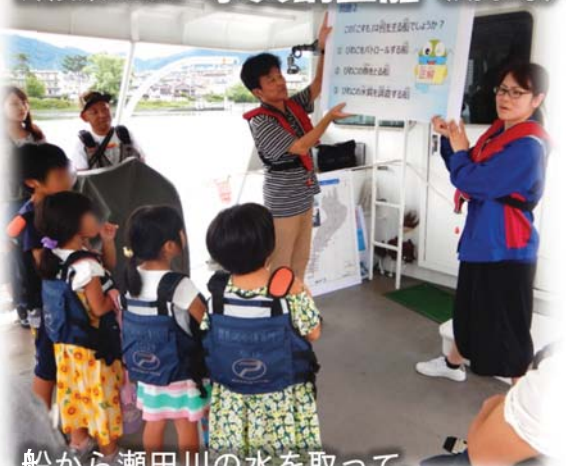
船から瀬田川の水を取って、水質やプランクトンを調べてみました。