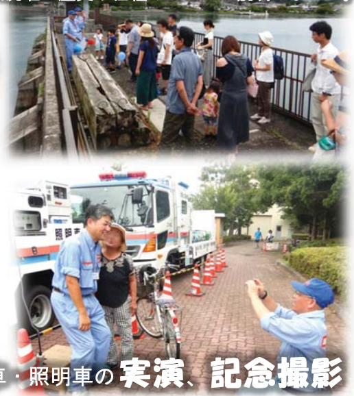
ポンプ車・河川パトロール車・照明車の実演、記念撮影