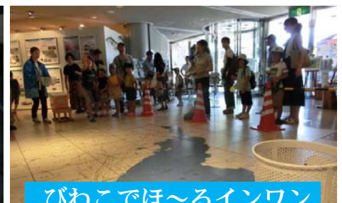
びわこでは～るインワン