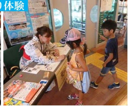
海でつながるゴミ拾い