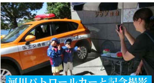
河川パトロールカーと記念撮影