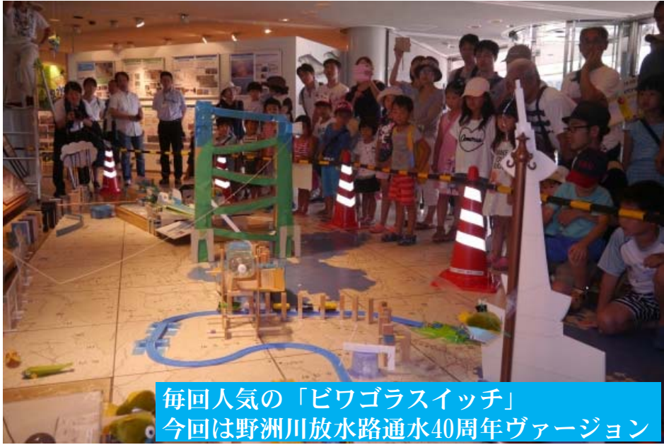
毎回人気の「ピワガラスイッチ」 今回は野洲川放水路通水40周年バージョン