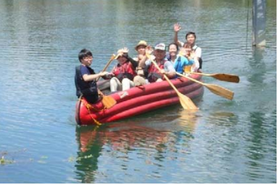
Eボートにのってみよう