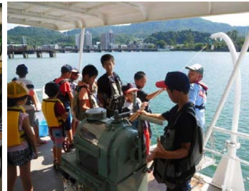
実際に採水しパックテストやプランクトンなどを観察