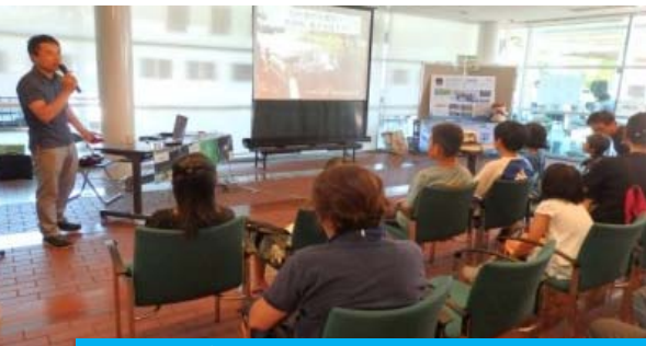
講演 びわ湖博士のおさかな探検