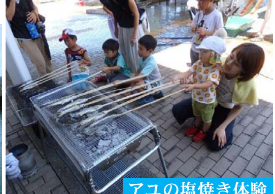
アユの塩焼き体験