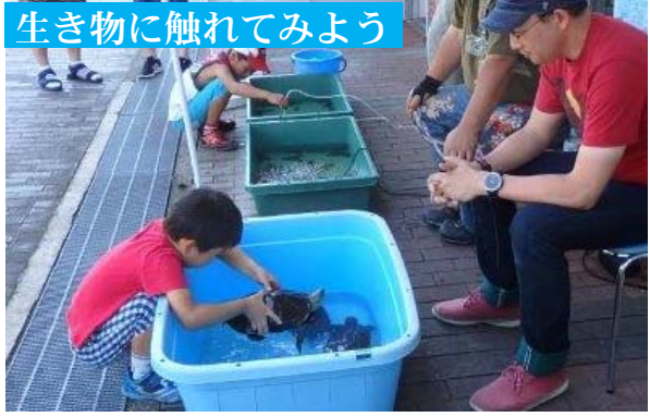
生き物に触れてみよう