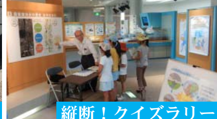
縦断！クイズラリー