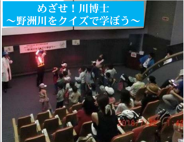
野洲川放水路通水40年の広報企画として、 見ながら楽しみながら野洲川を知ってもら う工夫をしました