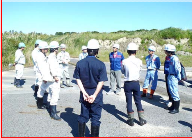
6.2 k 付近にて重要水防箇所や防災備蓄ヤードを合同で点検し意見交換を行った