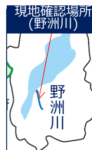
11.2k 付近にて低水護岸復旧状況、重要水防箇所説明