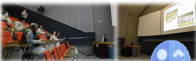
「瀬田川リバプレ隊」 ロゴマーク