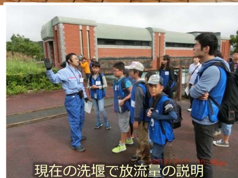
現在の洗堰で放流量の説明