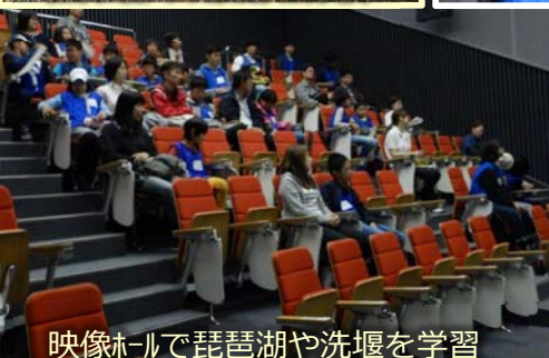
映像ホールで琵琶湖や洗堰を学習