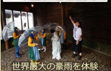
世界最大の豪雨を体験