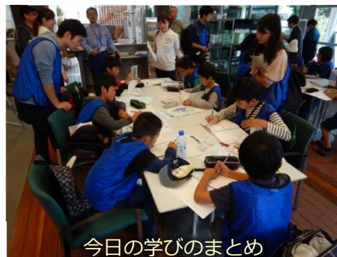
今日の学びのまとめ