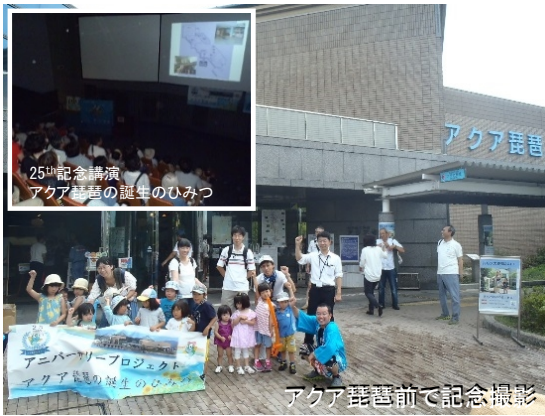
アクア琵琶前で記念撮影