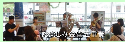
お楽しみ金管五重奏