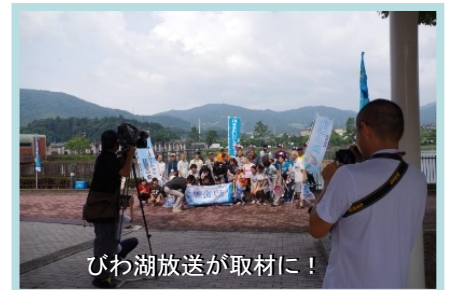
びわ湖放送が取材に！

水のめぐみ館アクア琵琶は、琵琶湖の水位管理が流域の発展に治水・利水・環境の面から貢献していることや、瀬田川洗堰が琵琶湖を抱える滋賀県だけではなく、下流の京都府や大阪府にとっても非常に重要な施設であることを、広く理解していただくことを目的として、平成4年11月に設置され、今年25周年を迎えます。様々なイベントを企画し、より一層、皆様に愛されるアクア琵琶を目指します。