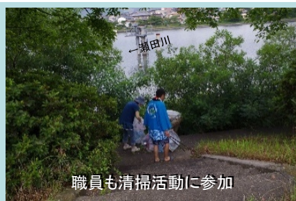
職員も清掃活動に参加