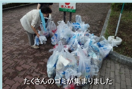
たくさんのゴミが集まりました