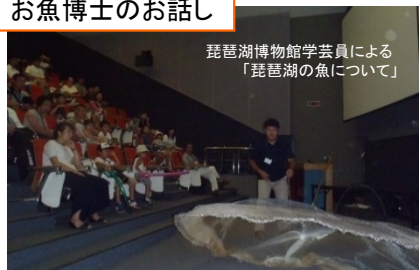
琵琶湖博物館学芸員による「琵琶湖の魚について」