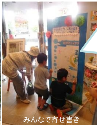
みんなで寄せ書き