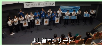
よし笛コンサート