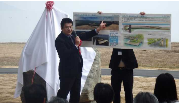
琵琶湖河川事務所長による事業概要説明