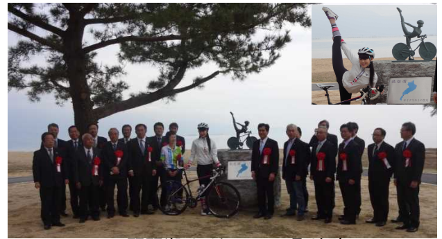
琵琶湖サイクリストの聖地碑