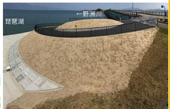
野洲川河口部の河川管理用通路整備状況

琵琶湖河川事務所は、地域の活性化・健康増進に資する河川整備を関係機関と連携し積極的に実施してまいります。