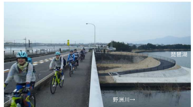
除幕式典後の記念サイクリング状況(野洲川河口部)