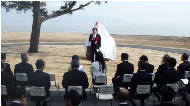
守山市長の式典挨拶

（滋賀県副知事、守山市長、(株)ジャイアント代表取締役社長、琵琶湖河川事務所長他）