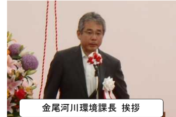
金尾河川環境課長 挨拶