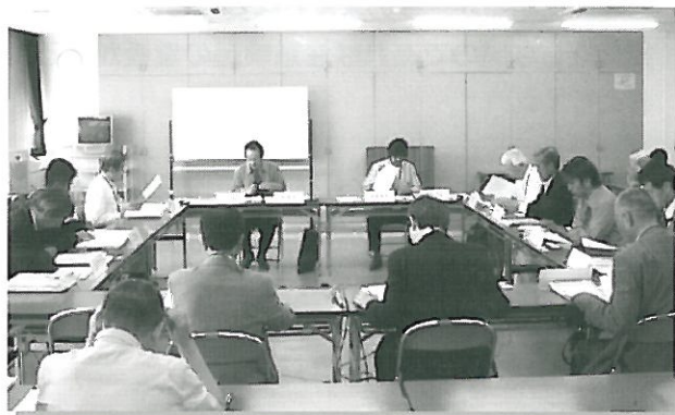
▲ 第26回河川保全利用委員会

平成21年6月2日（火）に「第26回 河川保全利用委員会（琵琶湖河川事務所）」が開催されました。今年度より第三期の委員会となり、当日は河川管理者から委員の委嘱について報告が行われた後、第三期の委員長・副委員長が選出されました。前回（第25回）委員会審議事項の承認がなされ、その後、継続占用許可申請施設（野洲川ふれあい広場）について現地調査、占用許可申請説明書及び審査結果一覧表に基づいて説明がなされ、委員会審議が行われました。