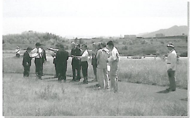
▲ 野洲川ふれあい広場 現地調査

占用目的が「親水広場」となっているが、占用目的をカテゴリー化したものはないのか。