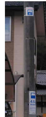
H30.3 まるまち看板設置