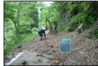
事業地内道路の落石等除去