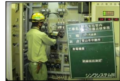
通信設備の点検・保守

※)淀川水系流域委員会(第22回)、「淀川水系河川整備計画策定に向けての説明資料(第2稿)」において、実施中のダムについて、「地域の地域生活に必要な道路や、防災上途中で止めることが不適当な工事以外は着手しない」とされたもの。