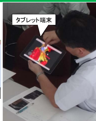
検討時のデータ確認