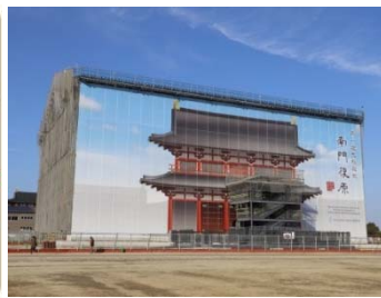
南門復原整備箇所