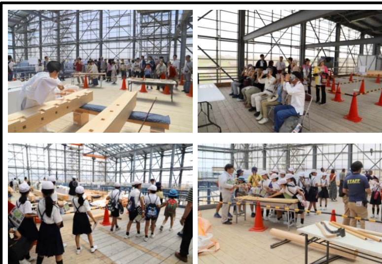
参考：前回の特別公開の様子（5月25日、26日実施）