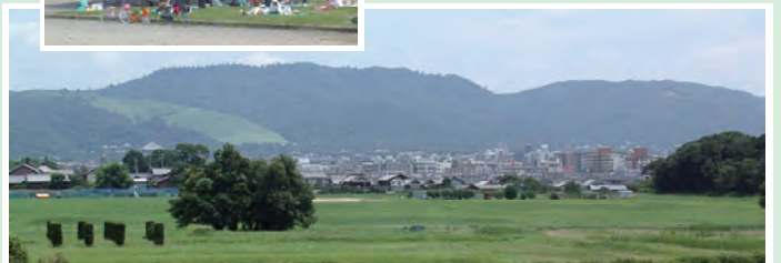
【第二次大極殿院(基壇復元)から東を望む(若草山～春日山)】