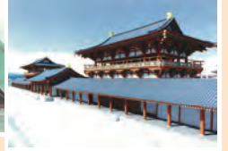
【第一次大極殿院復元イメージ】