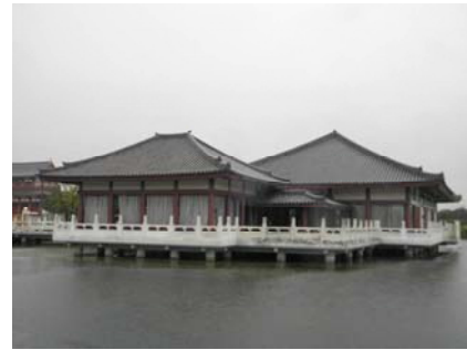
■北新大池に建つシルクロード博記念館

博覧会終了後は記念館として、シルクロードと平城京に関する資料が平成17年3月まで展示されていました。