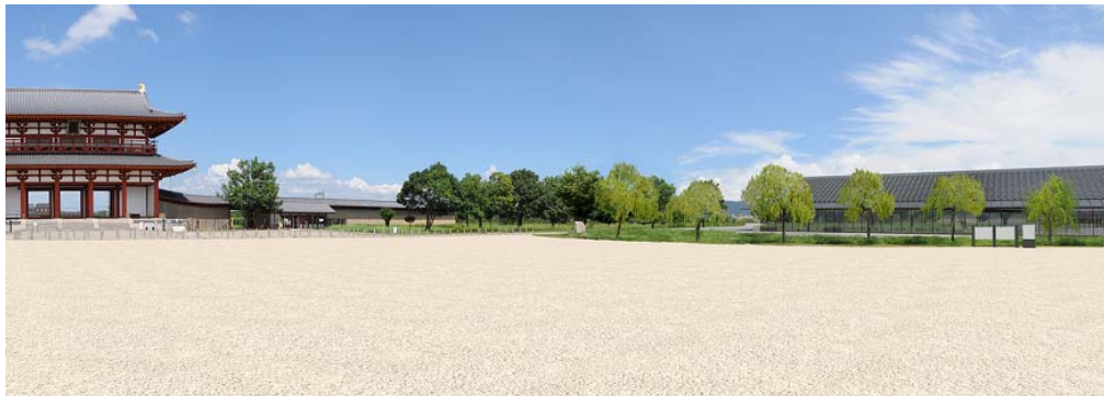
■拠点ゾーン整備イメージ（右側：平城宮跡展示館）

平城宮跡展示館は、国営平城宮跡歴史公園の正面玄関口として、園内の案内・利用情報の提供にあわせ、「平城宮跡に対する知識と理解を深めるためのガイダンス」や、「出土品の展示」等を行う施設です。