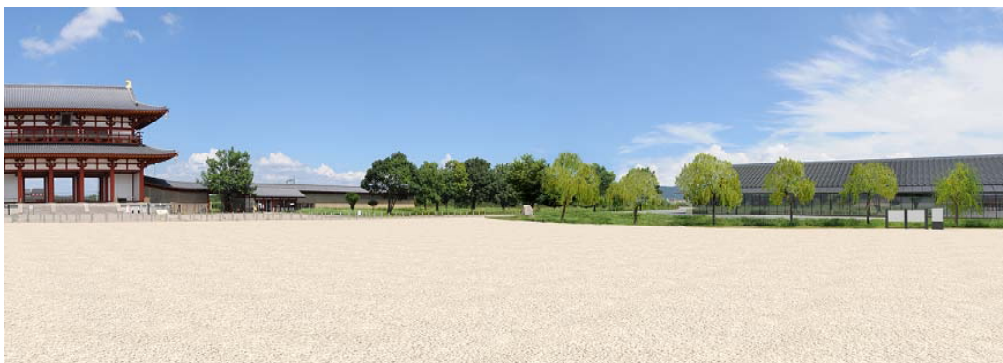
■平城宮跡展示館整備イメージ（右側）

国営平城宮跡歴史公園は、我が国を代表する歴史・文化遺産である平城宮跡の一層の保存・活用を図るため、平成20年度に事業化された国営公園です。国営平城宮跡歴史公園の正面玄関口として、園内の案内・利用情報の提供にあわせ、「平城宮跡に対する知識と理解を深めるためのガイダンス」や、「出土品の展示」等を行う施設です。