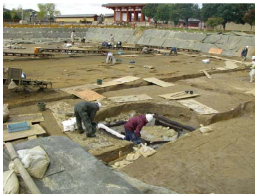
■平城宮跡展示館整備予定地での発掘調査